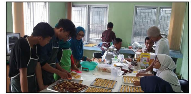
Pelatihan Tata Boga yang diselenggarakan BKS