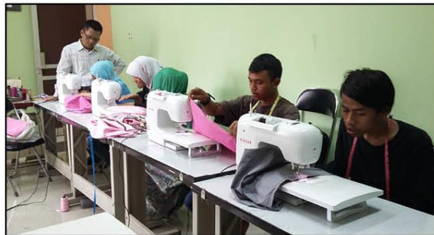
Pelatihan Menjahit yang diselenggarakan BKS

BKS memiliki misi-misi antara lain, memberikan pelayanan kesejahteraan sosial PMKS terlantar melalui sistem panti, meningkatkan profesionalisme SDM pelaku pelayanan kesejahteraan sosial melalui sistem panti dan meningkatkan kerjasama dan partisipasi masyarakat dalam memberikan pelayanan kesejahteraan sosial bagi PMKS terlantar melalui sistem panti.